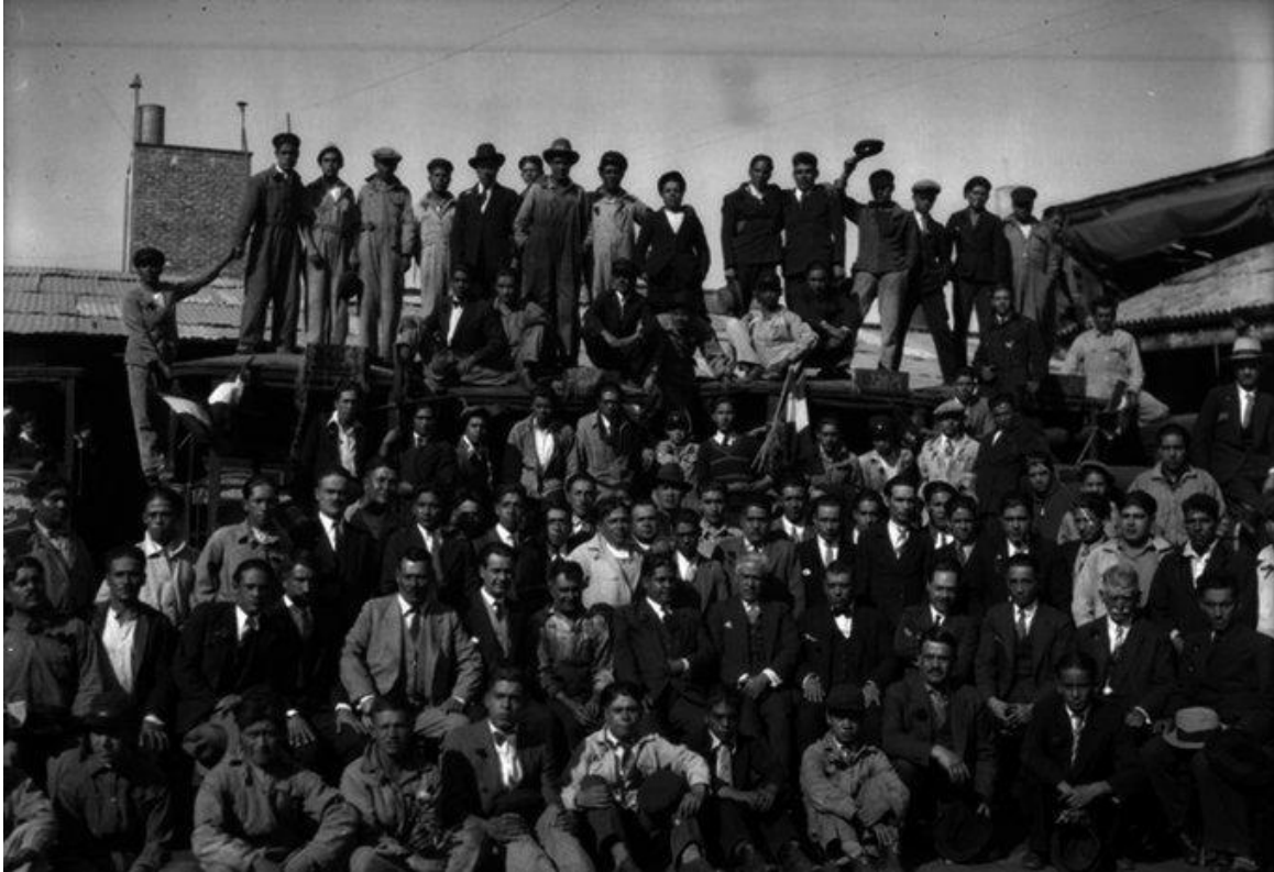
Imagen 3 – Huelga de Tranviarios en la Ciudad de México (6 de julio 2021)