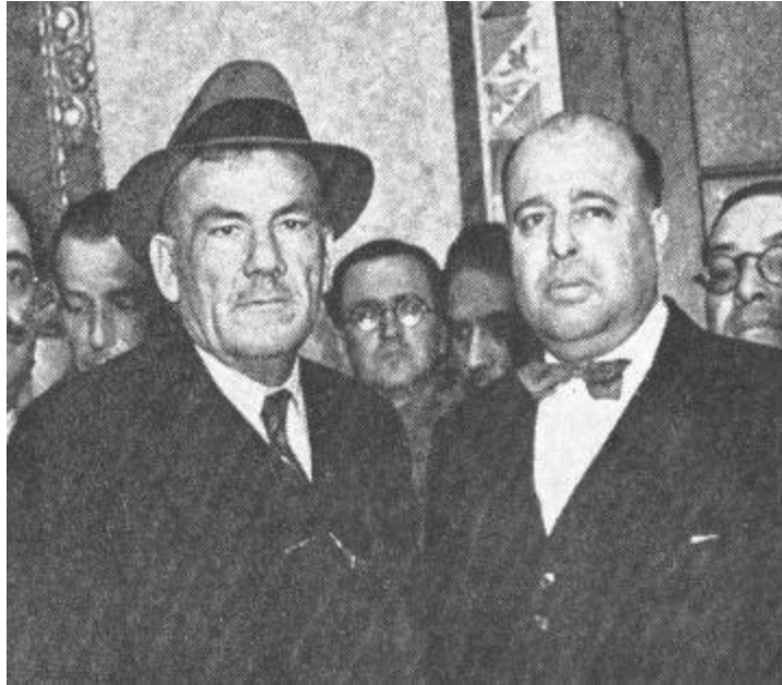
Imagen 1 – Morones y Calles (1925)